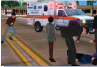
緊急時のファーストレスポンス