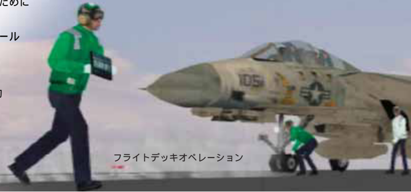
フライトデッキオペレーション